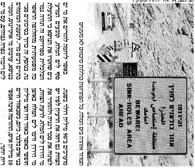
מבט על האזור המסוכן של המלח

המלח יביא להוזרות גבישי גבס שירדפו על המים וישנו את אופי ים המלח. בנוסף, קיים חשש לפי זה של אצות וחיידקים במקרה של חוספת מים מלוחים פחות העשיי ריים בורחה. הצוות קבע, שיש צורך במריקה יסודית של המחר לייים העלולים להתרחש בים ולברוק את האמצ עים המרטיים הנדרשים להקטנת הסיכון. מכשול נוסף שהעי לה הצוות הוא שהערכת המים עלולה לגרום לירחום מו תהום במלה, במיוחד לאור העובדה שאזור הערבה רגישי לרעידות ארמה וסובל מששפונות.